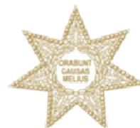
Colegio de Abogados de Lima Sur Pérou