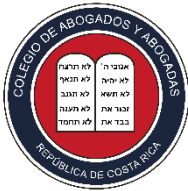
Costa Rican Bar Association Costa Rica