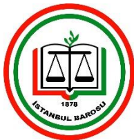
Istanbul Bar Association Turquie