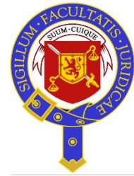
The Faculty of Advocates Écosse