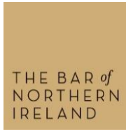
The General Council of the Bar of Northern Ireland Irlande du Nord