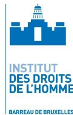
Institut des Droits de l'Homme du Barreau de Bruxelles Belgique