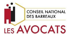
Conseil national des Barreaux France